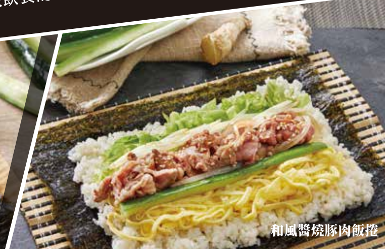
和風醬燒豚肉飯捲