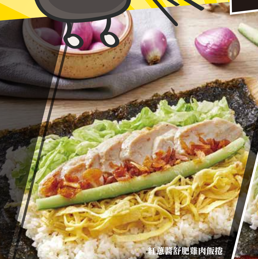
紅蔥醬舒肥雞肉飯捲

海苔飯捲是一種便利又健康的食物，它不但方便攜帶，也能避免食物沾手，並且不需要額外的餐具。這樣的特點非常符合現代人忙碌的生活方式，特別是在辦公室、學校或旅途中需要快速解決飲食的場合，更是一個非常方便的選擇。